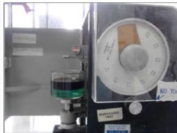
Tensiómetro de DU NOUY, tensión interfacial.